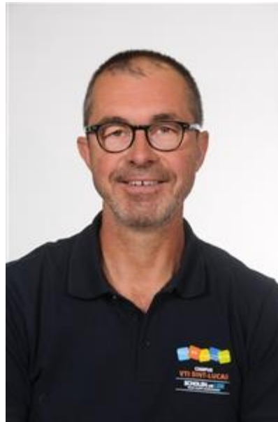
Christ Decock Leerzorg 4-5-6 tso